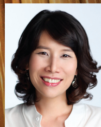
오르가니스트 | 전은배 Eun-Bae Jeon